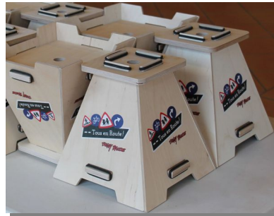
Nouvelles bases en bois Eco-responsables à lester jusqu'à 5Kg