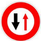
Priorité en face