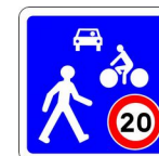
Zone de rencontre