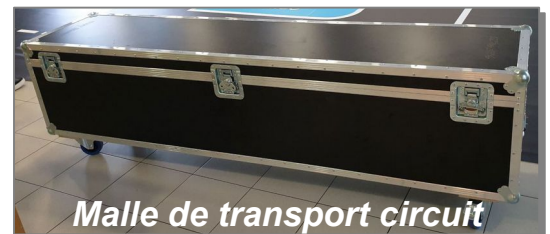
Malle de transport circuit