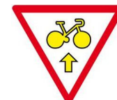
Cycles Autorisés Tout droit