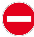
Sens Interdit Sauf Cycles