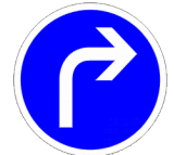
Obligation de tourner à droite