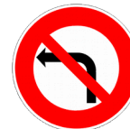
Interdit de tourner à gauche