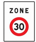
Entrée en Zone 30