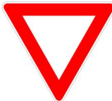
Cédez le passage