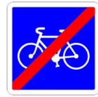
Fin de Piste Cyclable