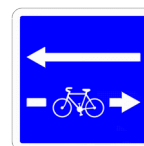
Double sens Cyclable À droite