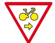
Cycles Autorisés À droite