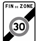
Fin de Zone 30