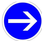
Sens obligatoire (réversible)