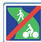
Fin de voie verte