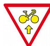
Cycles Autorisés Tout droit

Panonneaux d'autorisation associés aux feux tricolores