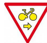
Cycles Autorisés À droite