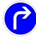
Obligation de tourner à droite