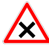
Croisement avec priorité à droite