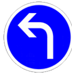
Obligation de tourner à gauche