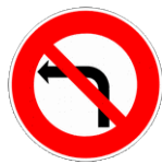
Interdit de tourner à gauche