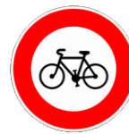
Interdit aux cycles