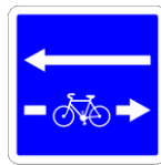
Double sens Cyclable À droite