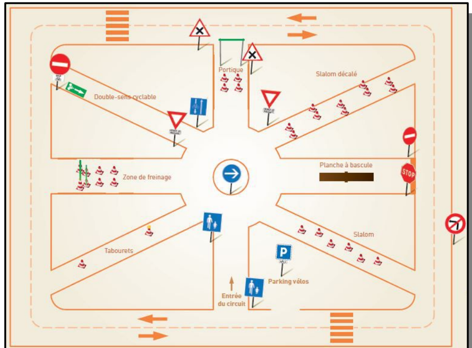
Taille des circuits : 23x30m

Ces modèles de circuit sont proposés par l'Inspection Académique du Nord dans le « Guide pratique de préparation et d'évaluation des compétences rouleur de l'APER » Document complet à télécharger sur www.tousenroute.com