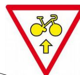
Cycles Autorisés Tout droit

Panonceaux d'autorisation associés aux feux tricolores