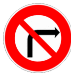
Interdit de tourner à droite