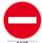
Sens Interdit Sauf Cycles