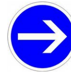
Sens obligatoire (réversible)