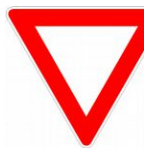
Cédez le passage