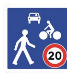
Zone de rencontre