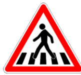
Attention passage piétons