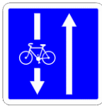
Double sens Cyclable En face